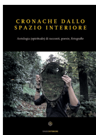
CRONACHE DALLO SPAZIO INTERIORE € 12 / 168 pag. ISBN 978-8897864-59-2