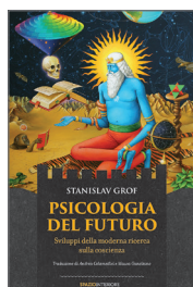
Stanislav Grof PSICOLOGIA DEL FUTURO € 24 / 384 pagine ISBN 978-88-97864-67-7